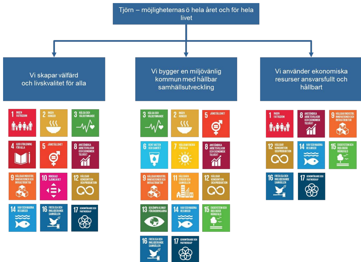
Figur 2 De 17 hållbarhetsmålen i Agenda 2030 sorterade under respektive strategiskt område

Figur 2 visar hur de 17 hållbarhetsmålen i Agenda 2030 kan sorteras under de tre strategiska områdena som Tjörns kommun har. Som man kan se i figuren kan många hållbarhetsmål kopplas till mer än ett av de strategiska områdena.