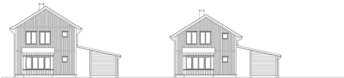
Veberga II, Exempel på husfasader