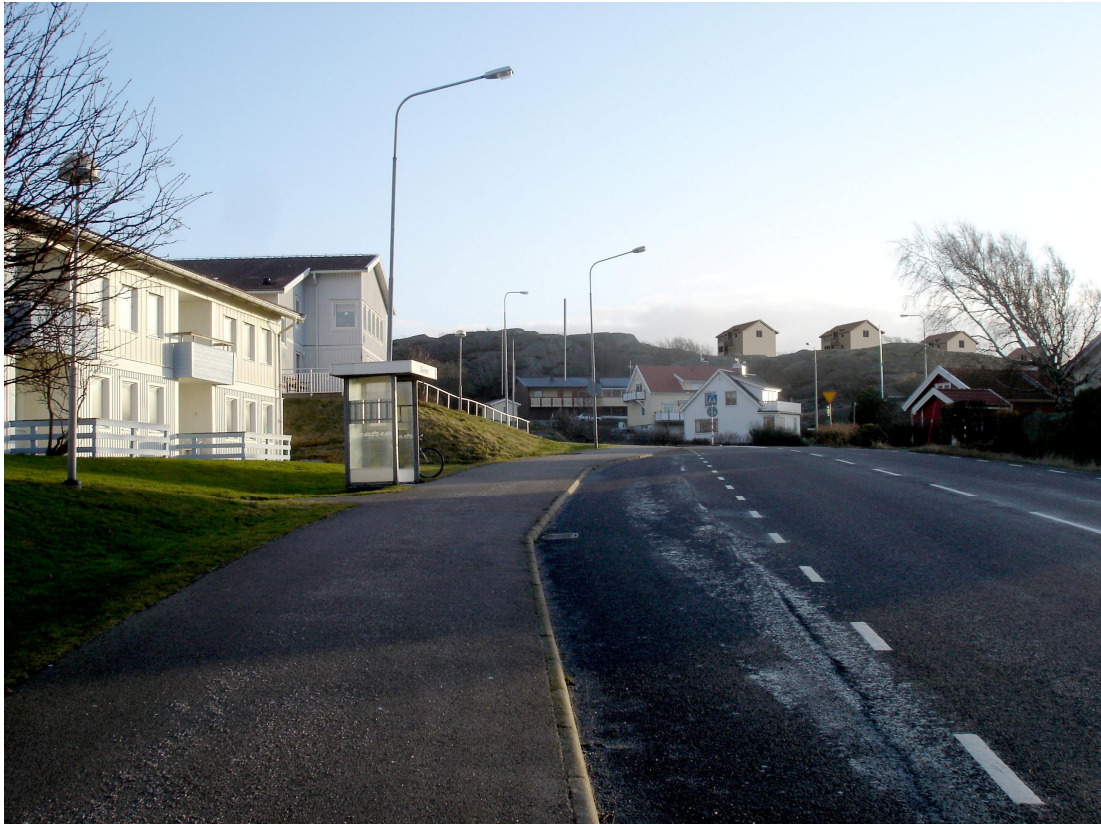
Fotomontage över föreslagna hus på Veberget