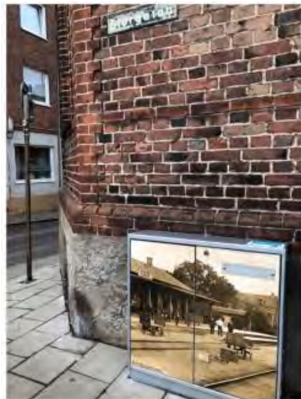
Historiska fotografier från 1800-talet som visas på en utställning i Nacka. Bilderna visar olika scener från den gamla staden, inklusive byggnader och människor.

http://stockholmsstad.vansterpartiet.se/files/2021/03/Motion-om-konstutst%C3%A4llning-p%C3%A5-El.pdf